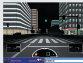
Fahrt bei Nacht