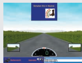
Übungen zum manuellen Schalten