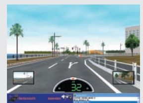
Übungsfahrt durch die Stadt