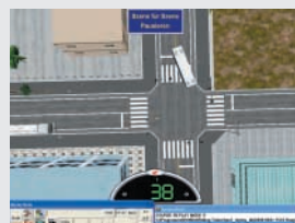
Satellitenperspektive – von oben senkrecht auf den Motorradfahrer