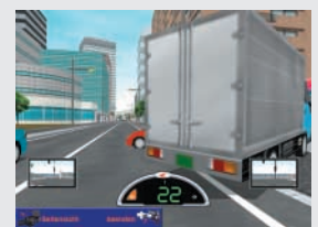
Unerwartetes Bremsen des Vordermanns