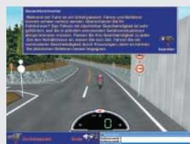
Zusammenfassung der Fahrt mit Verbesserungsvorschlägen