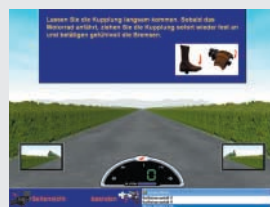
Übungen zum Beschleunigen und Bremsen

Auf den 11 Übungsstrecken im Stadtverkehr, die zur Schärfung der Gefahrenerkennung dienen, wird die Fahrleistung automatisch benotet und in einem gut lesbaren Format angezeigt. Gleichzeitig werden Verbesserungsvorschläge zur Fahrweise unterbreitet. Diese Berichte können später ausgedruckt werden.