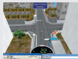
Ortsfester Beobachter – Blick von einer erhöhten Position auf einen bestimmten Punkt