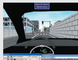
Aus der Sicht eines anderen Fahrers (z.B. im entgegenkommenden Auto)