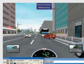
Aus der Sicht des Motorradfahrers