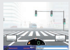
Fahrt bei Nebel