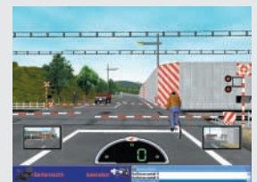
An einem Bahnübergang