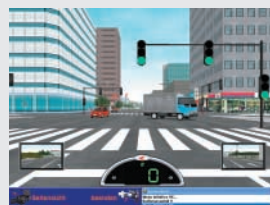
Fahrt bei Tag