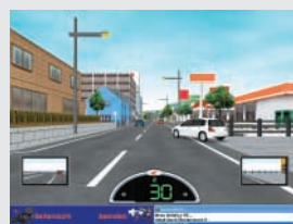
Plötzlich ausschender PKW von rechts