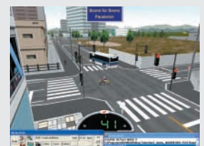
Vogelperspektive – Blick in beliebige Richtung aus erhöhter Lage