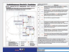
Benotung der Fahrleistung (für den Ausdruck wird ein separater Drucker benötigt)