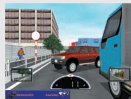
Plötzlich auftauchender PKW