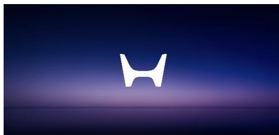
Neues Design des H Logos

Das aktuelle „H Logo“ reicht bis in das Jahr 1981 zurück, als es die vorherige Version ablöste. Anlässlich der Entwicklung der nächsten Generation von Elektrofahrzeugen beschloss Honda, ein neues H Logo zu kreieren, das für Honda Automobile steht und die Entschlossenheit der Marke zum Wandel zeigt, sowie die Einstellung des Unternehmens zum Ausdruck bringen soll, über den Ursprung hinauszugehen und ständig neue Herausforderungen und Fortschritte zu meistern. Dieser Designansatz, der an zwei ausgestreckte Hände erinnert, steht für das Engagement von Honda, die Möglichkeiten der Mobilität zu erweitern und die Bedürfnisse der Nutzer von Honda Elektrofahrzeugen umfassend zu erfüllen. Dieses neue H Logo wird für die nächste Generation von Honda Elektrofahrzeugen verwendet, einschließlich der Modelle der Honda 0 Series.